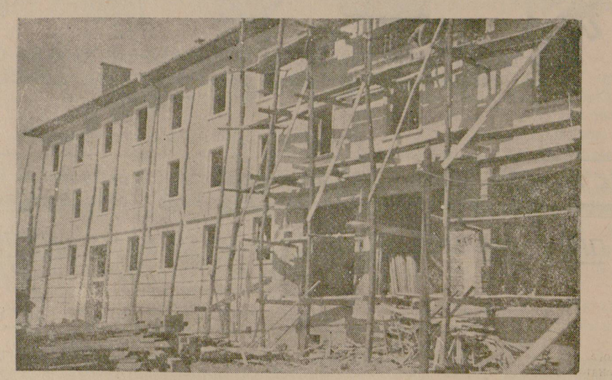
На снимката: Един от двата новостроящи се жилищни блока в гр. Горна Оряховица предназначен за транспортните работници