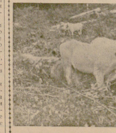
В. Събев наш спец. пратеник