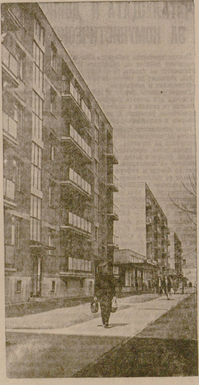
Така изглежда през 1965 година

до 1962 година не беше се къпал в Балатон. Независимо от своята преклонна възраст, той, както и преди, се труди в своя роден кооператив.