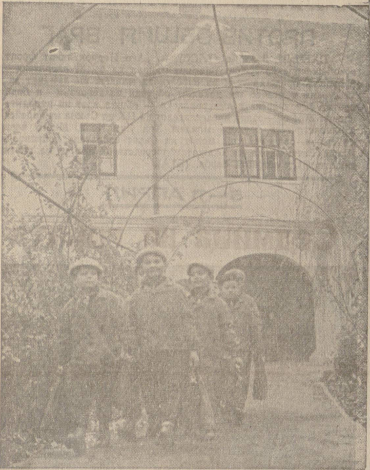
Бившият църковен дворец стана детски дом.

В областта Фейер, център на която е град Секешфехервар, има малко село Ельосалаш. Това село беше център на землените владения на католическата църква.