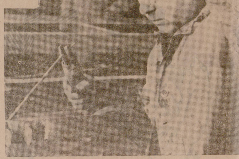
(Следва на 3 стр.)