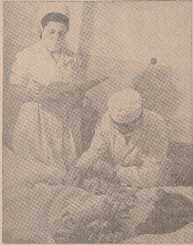
Грижата за човека — първа грижа на народната власт