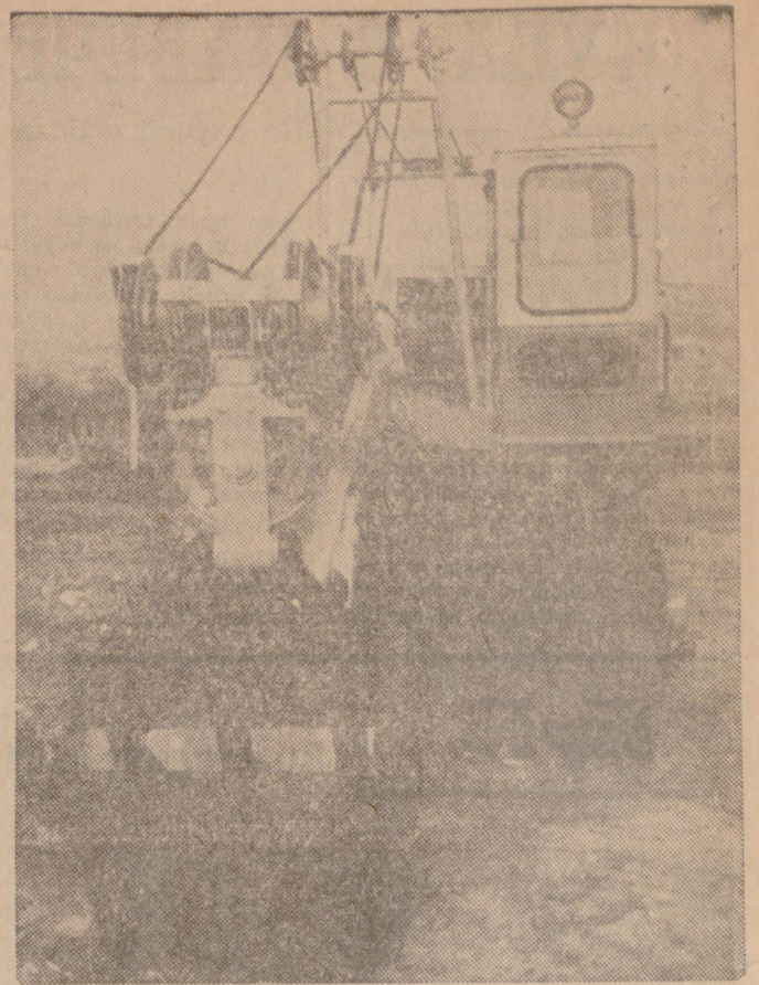
Новият багер, произведен на ДМЗ „Червена звезда“