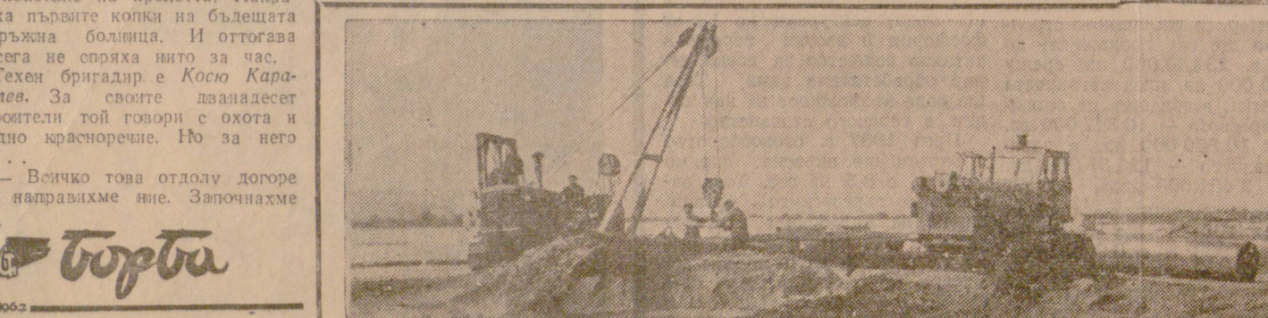
Земнарязът на площадката на строежа на Химкомбината в Свищов.