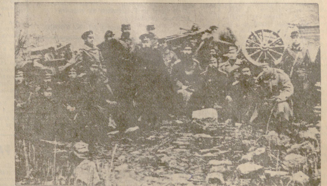
Легендарният генерал Скобелев (в центъра с бакембардией) сред група офицери и войници от коннопланинска батарея в Балкана (близо до Шипка).

Представителни групи се отправиха към паметниците на генерал Гурко, маршал Толбухин и Васил Левски, за да скъпят частича от свещената пръст и я отправят ведно с щафетата към Музея в г. Плевен.