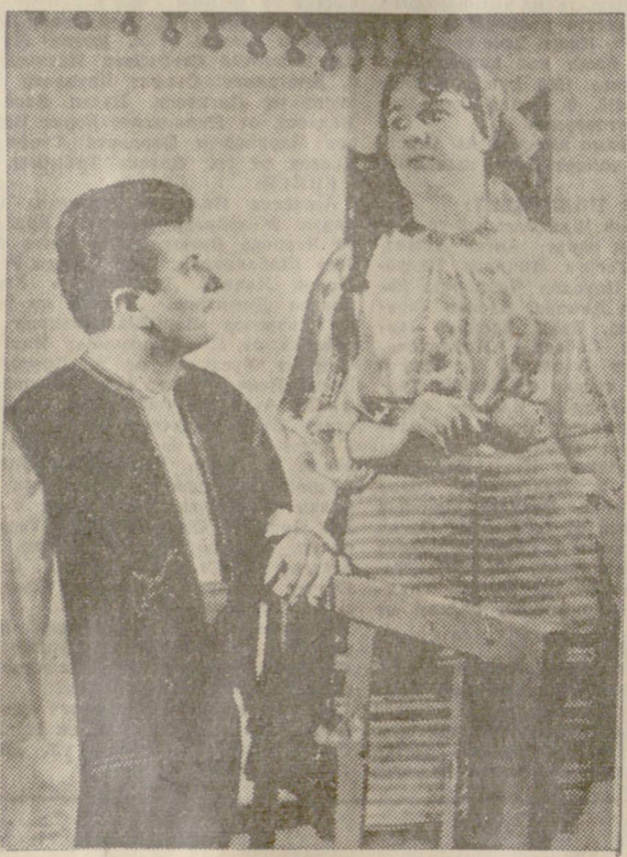
„Майстори“ от Р. Стопнов на сцената в Първомайци.

Пионерите, участвували в срещата, решиха да се открие спешната книга на името на Окръжната пионерска организация. Съдбата от трудовите дела на пионерите да се събират в нея, за да бъде изграден във Велико Търново паметник — вечен огън на родолюбието, в чест на 25-годишнината от Свободата, като дар от пионерите в окръга.