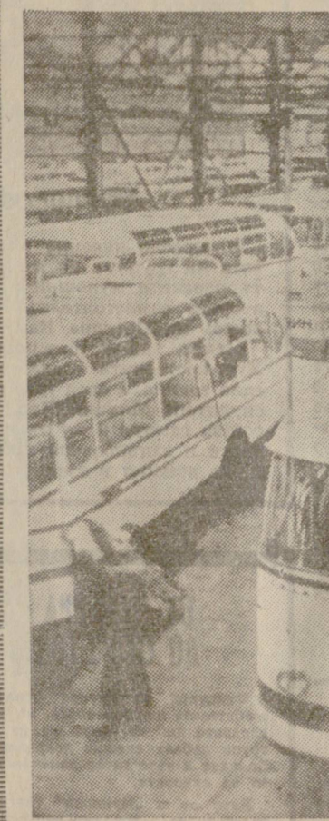
СССР, ДВОВ. С 25 процента се увеличи износът на белоенски автомобили, произведени на Лвовския автомобилен завод. Продукцията на завода се изнася за България, ГДР, Монголия, Югославия, Куба, ОАР и др. На снимката: автобуси, изработени за България.

Няколко години след САЩ страните от Западна Европа дълбоко останаха какъв коренен преврат причинява на нашата икономика използваването на електронни машини и на техниката за преработване на информацията. Проманата, която се изразява засега в първо то колебливо сриване, е възприета в САЩ от няколко години. Западна Европа я предвижда, но се бави да я възприеме и да я разбере.