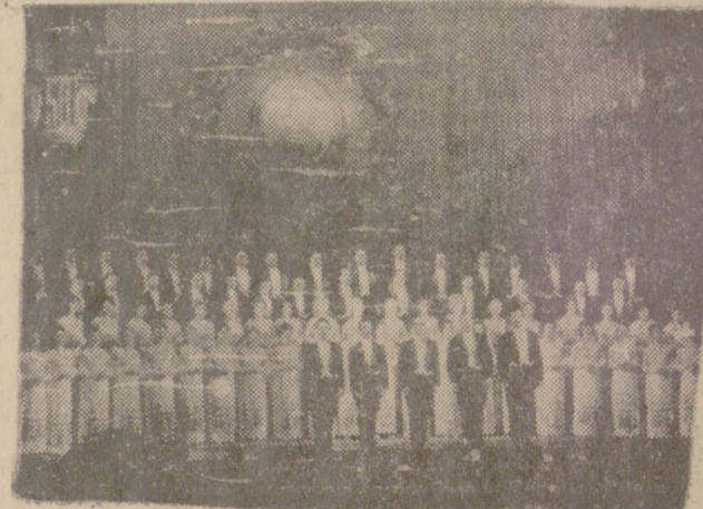
КИЕВ. Академическата капела на УССР „Думка“, носител на ордена „Червено знаме на труда“.