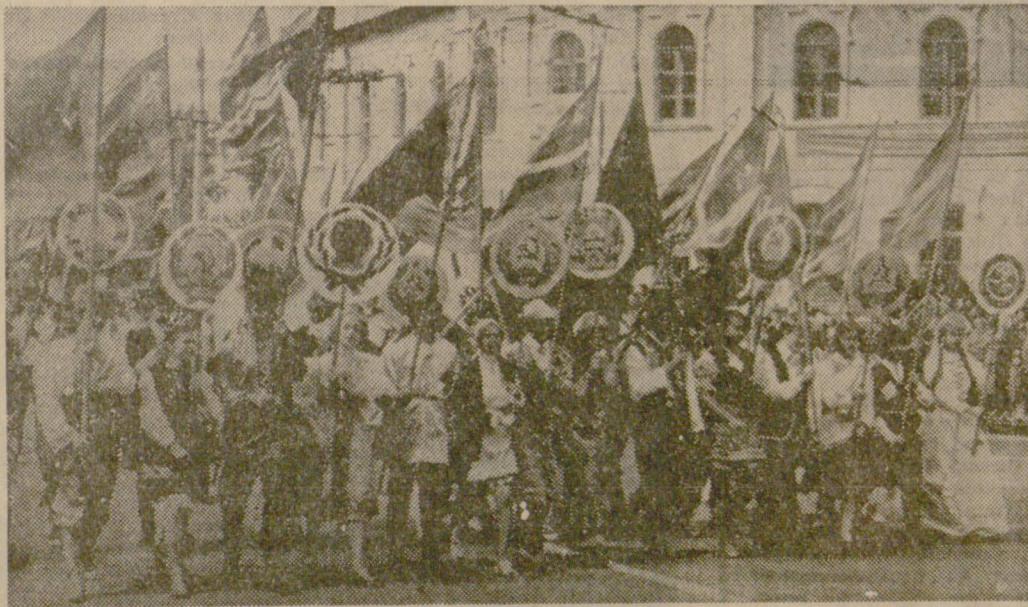
Полтава. Манифестация на трудещите се, посветена на 50-годишнината от създаването на Съюза на съветските социалистически републики.

инструктор в Областния комитет на КПУ в Полтава