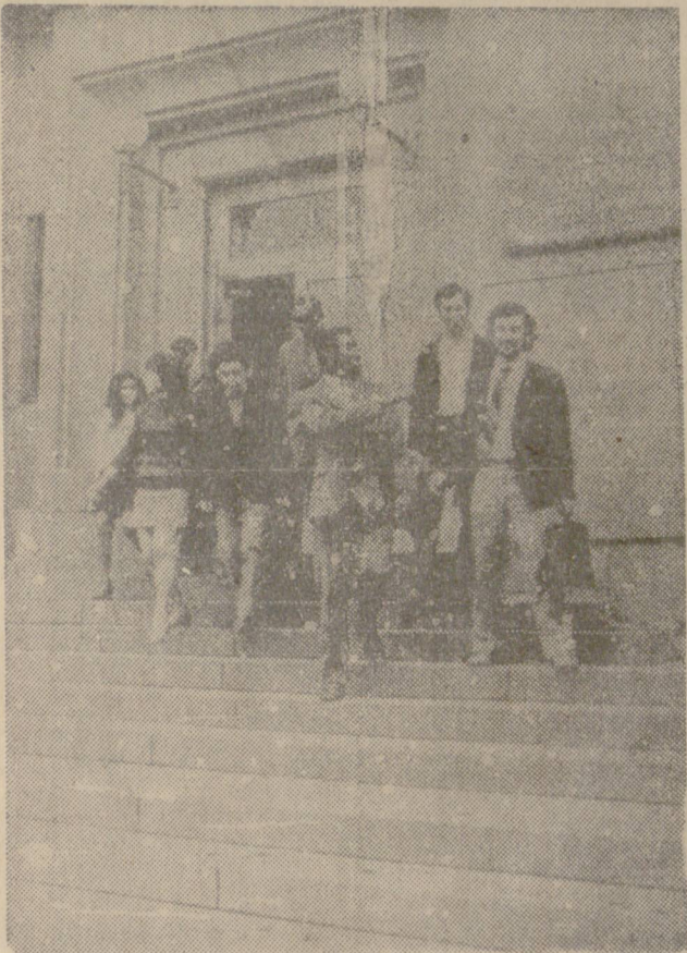
МОСКВА. Университетът на дружбата „Патриотичен Пловдив“ е дружно многонационално семейство. Около 3.5 хиляди студенти от 84 страни на Азия, Африка и Латинска Америка се учат тук.